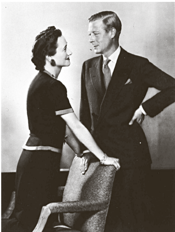
ET EDELT EKTESKAP: Hertugen og hertuginnen av Windsor veltet seg i diamanter og rubiner.

Wallis Warfield giftet seg i 1916 med en marineoffiser, og for 2. gang i 1928 med Ernest Simpson. Tidlig på '30-tallet møtte hun prinsen av Wales, kommende Kong Edward VIII. Det ble stormende forelskelse og da Edward ytret ønske om å gifte seg med Wallis, møtte han kraftig motstand i regjeringen. Hun ble