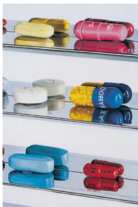
SYNTETISK LYKKERUS: «6 Pills» olje på lerret (91x61 cm). Det er et av Hirsts mange «pillebilder» og vurderes til 1,5-2 millioner kroner.

Nå regnes de syltede kyrne for å være Hirsts viktigste verk - et ikon for 1990-tallskunst - med en markedsverdi på ca. 100 millioner. For ett år siden begynte verket å lekke, og det er nå på en av Hirsts fabrikker til reparasjon.