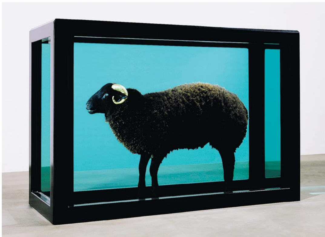
DET SORTE FÅR: «The Black Sheep with the Golden Horn». En stor sau med sort ull og horn i 18 karat gull. Den står i en beholder (110x162x64 cm) med formalin. Vurdering: 20-30 millioner kroner.