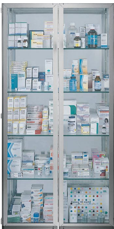
MEDISINSKAP: «Landscape and Memory». Verket består av medisinfopkninger og pilleesker i en glassmonter innrammet av rustfritt stål (180x92x36). Det forventes å gå for 5-7 millioner kroner.

kjøpte det i 1996 til Astrup Fearnley Museet for 1 million kroner.