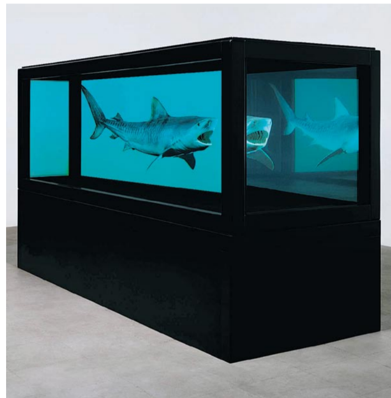
TIGERHAI PÅ TANKEN: «The Kingdom». En tigerhai flyter i formalin i en beholder av glass og stål (214x383x141 cm). Den har en vurdering på 40-60 millioner kroner.